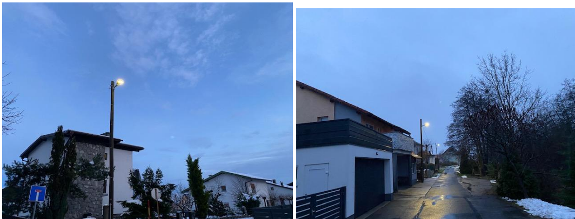
Slike narejene 17.1.2023 ob 17:04