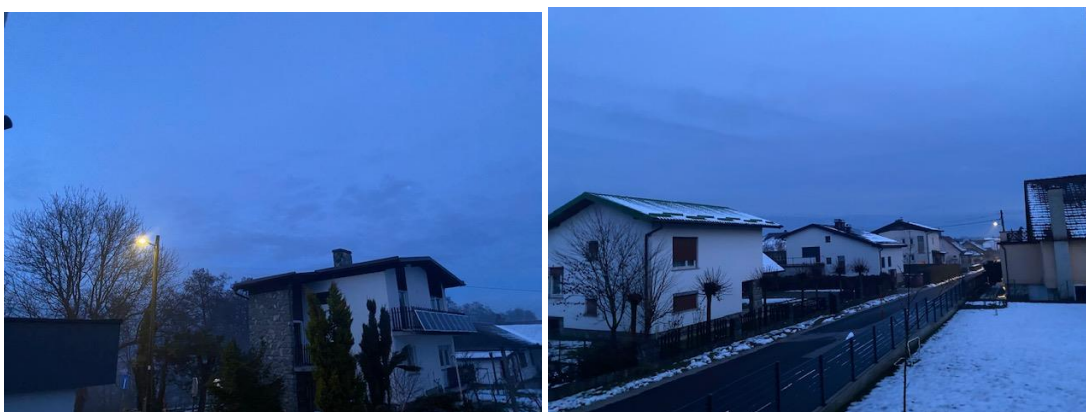
Slike narejene 19.1.2023 ob 07:43