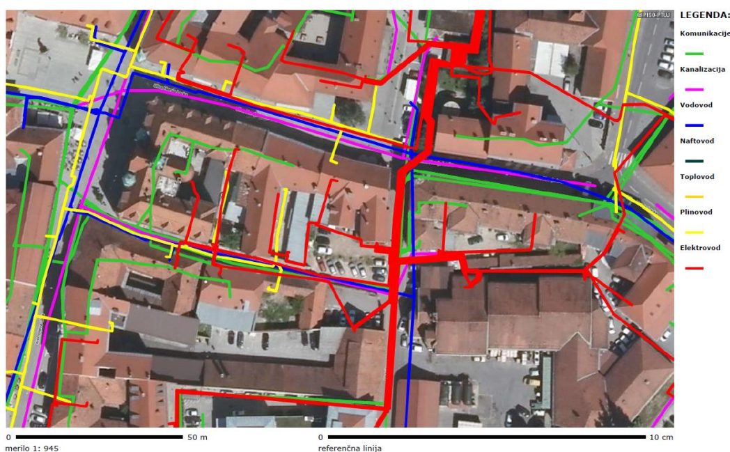
Gospodarska infrastruktura (GJI) > Skupen prikaz (En,Ko,Ek)